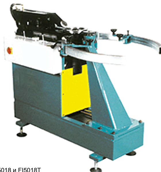
Fittingformer FI5018 и FI5018T