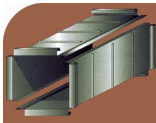
L-образная секция с коннекторами типа TDC и замками Pittsburgh