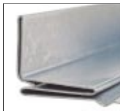
S-образная рейка (шина)

В стандартный комплект поставки включены удлиненные с обеих сторон вспомогательные валы, позволяющие использовать поставляемые по заказу дополнительные комплекты формирующих роликов для изготовления разнообразных профилей, включая Pittsburgh , фланец, стоячий шов, T-образный коннектор и другие.