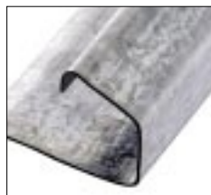
Дополнительный профиль для TDC зажимов