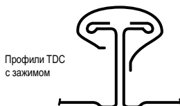
Профили TDC с зажимом

Для заказов и справок звоните по телефонам: (4732) 77-31-04 • (495) 628-05-35 или посетите наш сайт www.metalprom.com